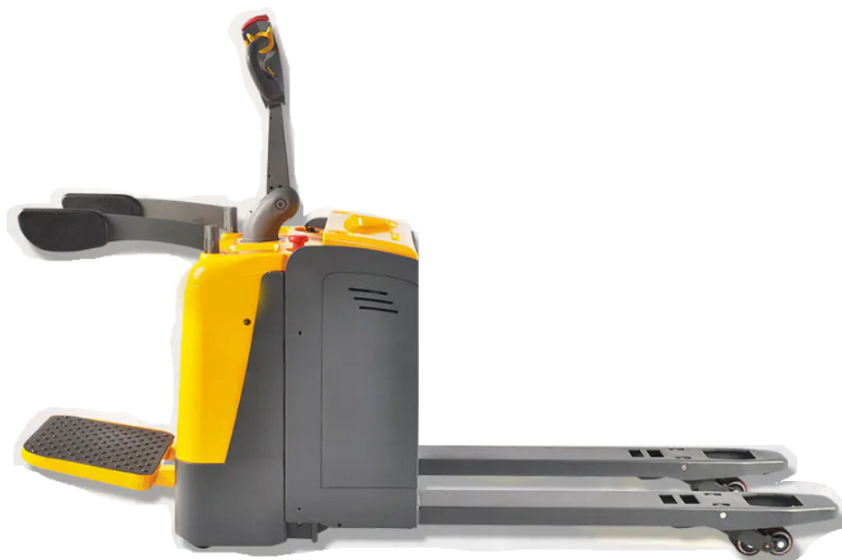
Cabezal timón FREI con botón de elevación de dos lados (Opcional)