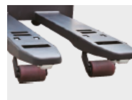
Rodillo de entrada de fácil manejo