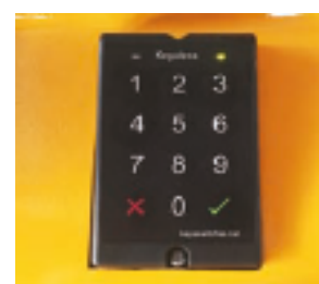
Acceso mediante teclado (opcional)